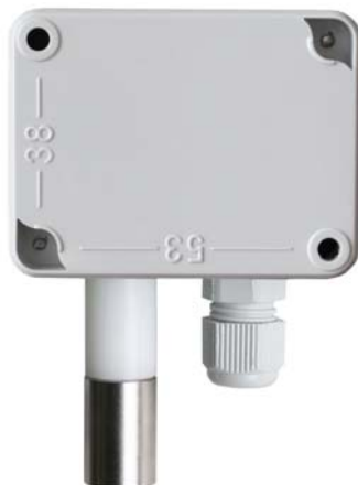
Abb. 2 Rückansicht mit Bemaßung der Öffnungen für die Befestigung